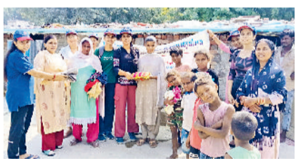
बहादुरगढ़। झुग्गी में रहने वालों को कपड़े देती स्वयंसेविकाएं।