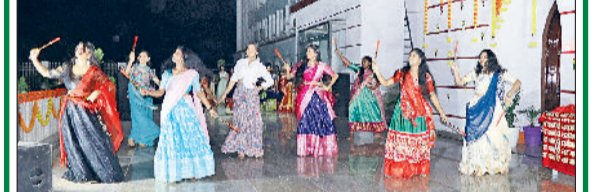
झज्जर। कार्यक्रम में डांडिया नृत्य की प्रस्तुति देते हुए छात्राएं।