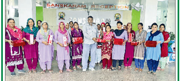
झज्जर। हाथों में पुरस्कार लिए हुए सफाई कर्मी।