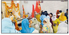
बहादुरगढ़। वीरवार को हरिदास मंदिर में माथा टेकती महिला श्रद्धालु।