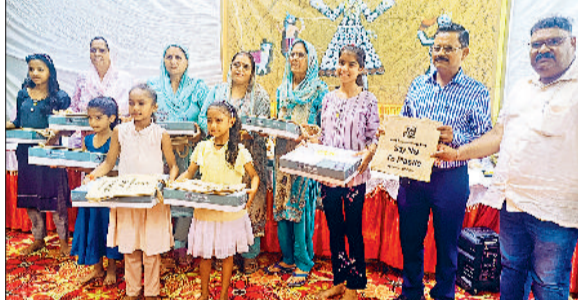
बहादुरगढ़। सांखोल में सांझी बनाने वाली महिलाओं व बच्चियों को सम्मानित करते अतिथी।

दरअसल, विलुप्त होती सांझी परंपरा को नई पीढ़ी से रूबरू कराने के लिए संस्था की ओर से लगातार पांच साल से यह आयोजन किया जा रहा है। इस बार सांझी प्रतियोगिता के बजाय उत्सव का आयोजन हुआ।