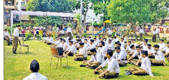
बहादुरगढ़। संघ की उपलब्धियों की जानकारी देते पदाधिकारी।