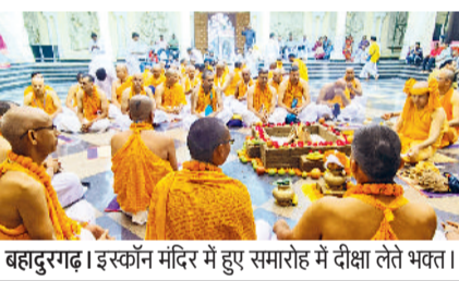
बहादुरगढ़। इस्कॉन मंदिर में हुए समारोह में दीक्षा लेते भक्त।