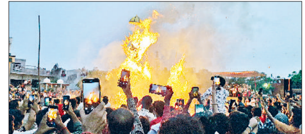
झज्जर। रामलीला मैदान में धू-धू कर जलते हुए रावण, मेघनाथ, कुंभकर्ण के पुतले।