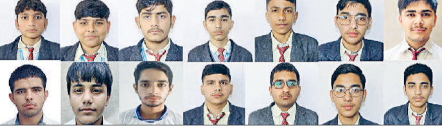
झज्जर। एनडीए परीक्षा के सफल विद्यार्थी।