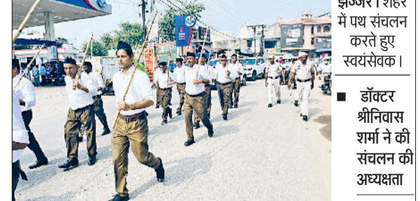
झज्जर। शहर में पथ संचलन करते हुए स्वयंसेवक।