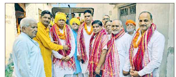
झज्जर। दुजाना गांव में कार्यक्रम के दौरान मुख्यातिथि का स्वागत करते हुए आयोजक कमेटी सदस्य।