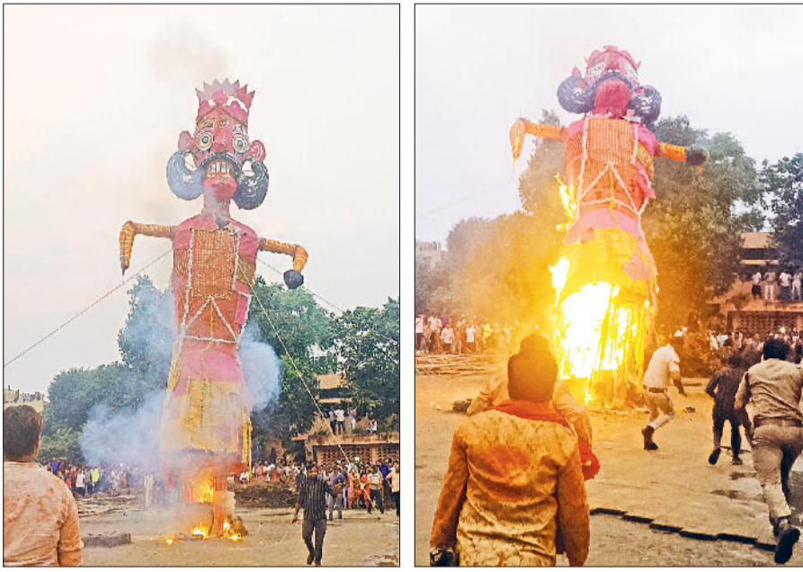
बहादुरगढ़। पुराने कोर्ट परिसर में धू-धू कर जलता दशानन तथा आग लगते ही गिरने लगा रावण का पुतला।

शहर के बादली रोड स्थित पुराने कोर्ट परिसर में विजयदशमी पर रावण दहन देखने के लिए असंख्य लोगों की भीड़ उमड़ी। हालांकि बारिश के कारण भीगा होने के कारण रावण का पुतला जलते-जलते ही धराशायी हो गया। इससे पहले विधायक राजेश जून ने रावण के पुतले को आग के हवाले किया। वीरवार को सुबह से ही घरों में अपराजिता पूजन, सरस्वती पूजन व शत्रु पूजन विधि विधान से किया गया। विजय का प्रतीक दशहरा पर्व बहादुरगढ़ में पूरी श्रद्धा व उल्लासपूर्वक मनाया गया। सनातन धर्म परोपकारी सभा द्वारा शहर के पुराने कोर्ट परिसर में सार्यकाल करीब 6 बजे रावण के पुतले को आग के हवाले किया गया। मुख्य अतिथि के रूप में विधायक राजेश जून ने मेले में मौजूद लोगों से भगवान राम के चरित्र से प्रेरणा लेने का आह्वान किया।